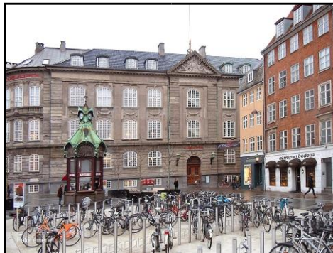
Torvet i dag.

Det lille, trekantede torv ligger ved Nørreport Station, hvor Fiolstræde møder Nørre Voldgade. Skidentorv var det oprindelige navn indtil 1842, hvor det blev omdøbt til Nørre Torv. Fra 1875 blev det officielt en del af Nørregade. Man kan sige at vore forfædre gav tingene deres rette navn.